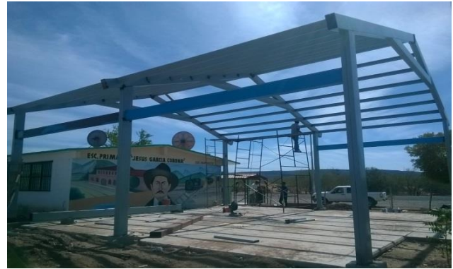
Ubicación Tesia y sus Anexos