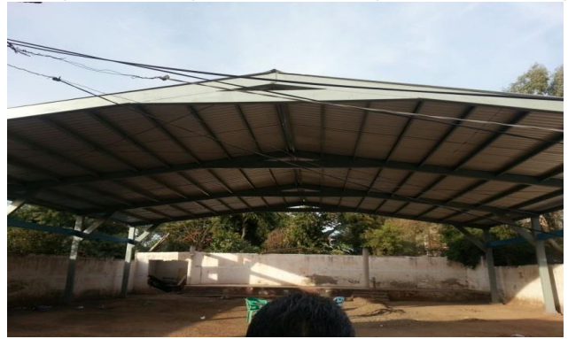
Ubicación: San Ignacio Cohuirmpo