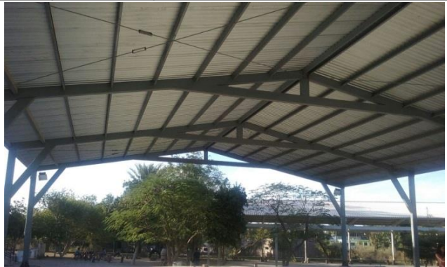
Ubicación Pueblo Nuevo