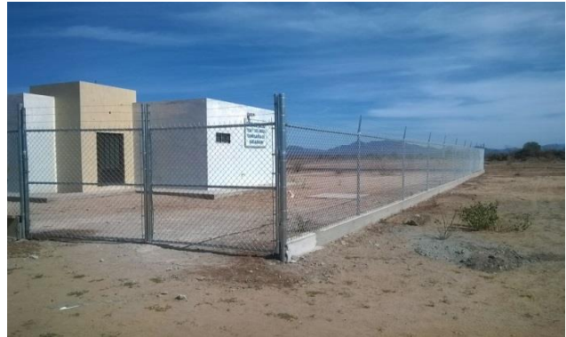
Ubicación Tesia y sus Anexos