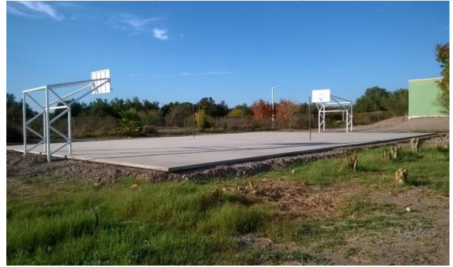
Ubicación Loma del Refugio