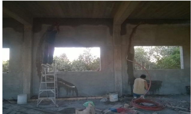
Ubicación Col. Beltrones